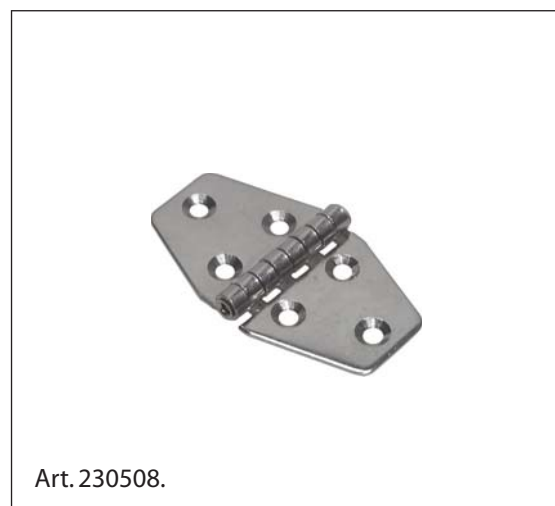
Cerniera, Acciaio Inox 1.4301