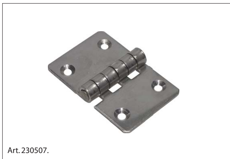
Cerniera, Acciaio Inox 1.4301