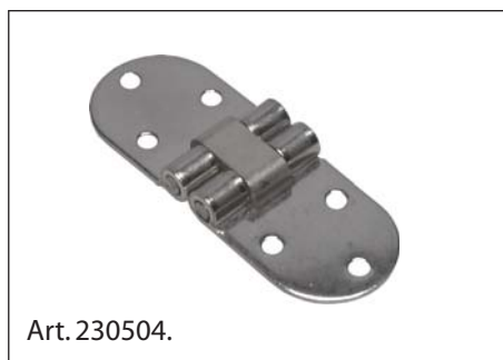
Cerniera per tavoli, Acciaio Inox 1.4301