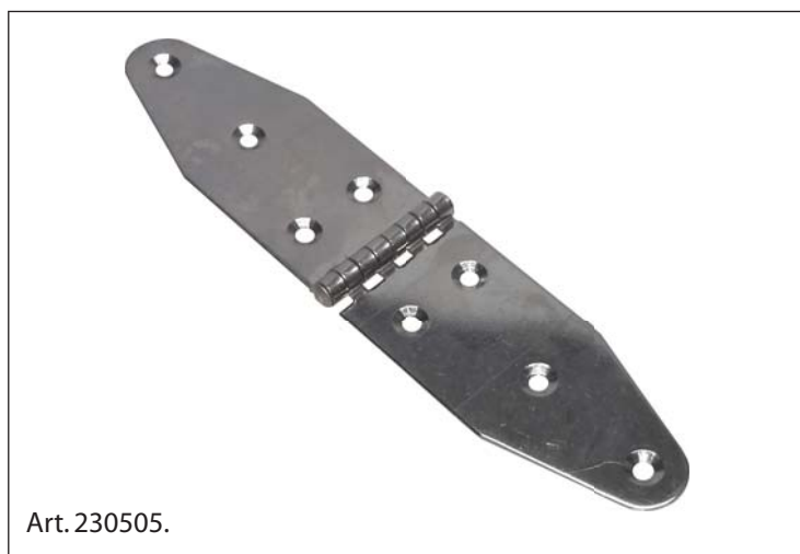
Cerniera, Acciaio Inox 1.4301