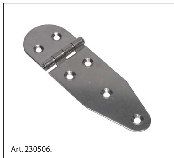
Cerniera, Acciaio Inox 1.4301