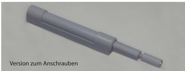
Version zum Anschrauben